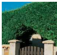
Thuja occidentalis in Sorten, Lebensbaum

Wildhecken Hecken aus einheimischen Gehölzen.