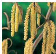
Corylus avellana Haselnuss

Niedere Hecken, frei wachsend Als niedrige Wegbegleitung, Einfassungen von grösseren Beeten, lockere Abgrenzungen.