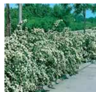
Spiraea 1 vanhouttei Spierstrauch

Grosse Hecken, frei wachsend Diese Art von Hecke eignet sich nur für Gärten und Parks mit grosszügigen Platzverhältnissen, da diese Pflanzen ein starkes Wachstum aufweisen.