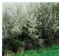
Prunus spinosa Schlehorn

Wildhecken Hecken aus einheimischen Gehölzen.