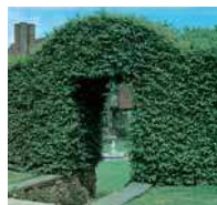
Carpinus betulus Hainbuche

Mittlere Hecken, geschnitten Das ist die häufigste Form einer Hecke.