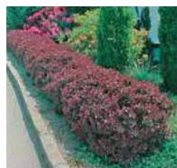
Berberis thunbergii •Atropurpurea Nana• Kugelberberitze

Niedere Hecken, geschnitten Besonders in streng geometrischen Gärten und in Bauerngärten beliebt als Beeteinfassungen.