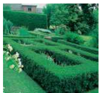
Buxus sempervirens in Sorten Buchsbaum