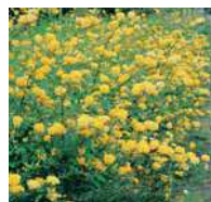
Kerria japonica Ranunkelstrauch