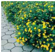
Potentilla fruticosa Fingerstrauch

Niedere Hecken, frei wachsend Als niedrige Wegbegleitung, Einfassungen von grösseren Beeten, lockere Abgrenzungen.