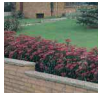
Spiraea japonica Spierstrauch