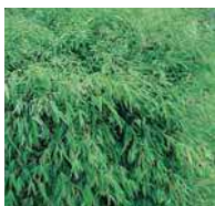
Fargesia murielae Schirmbambus

Mittlere Hecken, frei wachsend Dieser Typ Hecke sollte öfters verwendet werden, da der Blütenreichtum besonders gut zur Geltung kommt.