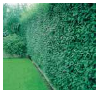
Ligustrum in Sorten Liguster