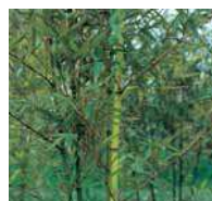
Phyllostachys aurea Gelber Bambus