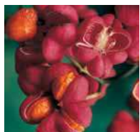
Euonymus europaeus Pfaffenhütchen