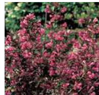
Weigela florida •Victoria•, Weigelie

Mittlere Hecken, frei wachsend Dieser Typ Hecke sollte öfters verwendet werden, da der Blütenreichtum besonders gut zur Geltung kommt.