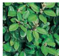
Elaeagnus 1 ebbingei Ölweide

Bei weiteren Fragen wenden Sie sich an unser engagiertes Fachpersonal. Wir beraten Sie gerne.