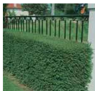
Lonicera nitida •Elegant• Heckenkirsche

Mittlere Hecken, geschnitten Das ist die häufigste Form einer Hecke.